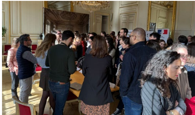
Les élèves de l'IRA en déambulation sur les stands de présentation des missions de la préfecture

Les visiteurs sont repartis enchantés et leur curiosité et intérêt s'en sont trouvés attisés sur nos missions... un bel exemple de promotion des missions et métiers de la fonction publique d'Etat !